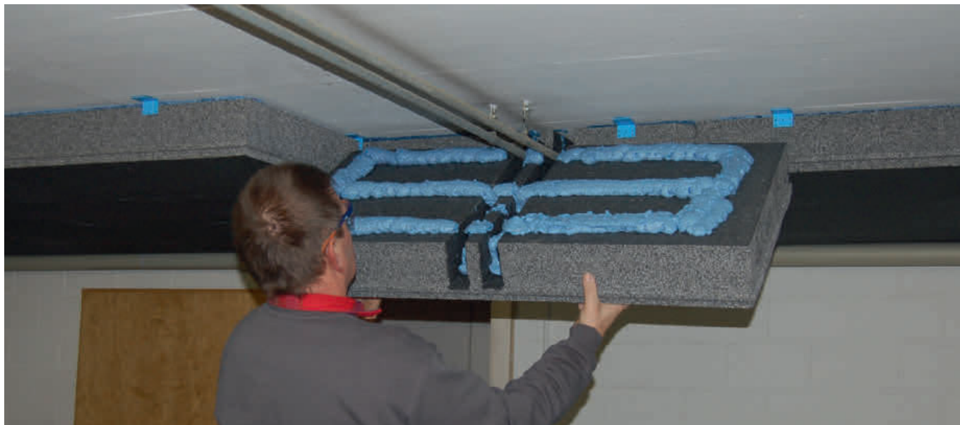
Montage der Wärmedämmung