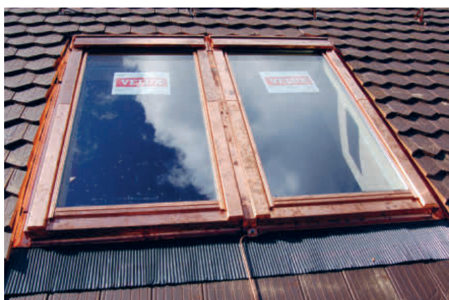
Dachfenster von aussen

Das Velux-Dachfensterprogramm deckt die vielfältigsten Standardanforderungen und Sonderwünsche ab. Um sich im Dschungel der Möglichkeiten zurechtzufinden, empfiehlt sich ein Beratungsgespräch durch einen Fachmann oder ein Besuch in der Velux-Ausstellung in Aarburg.