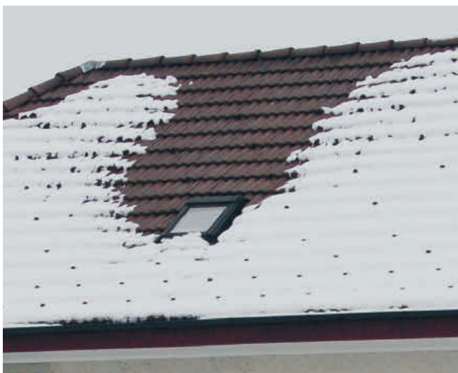
Mangelhafter Anschluss von Dämmung und Dampfbremse

Beim Einbau werden sämtliche Schichten des Daches von der Innenverkleidung bis zur Eindeckung tangiert. Beim Anschluss der Innenverkleidung steht vor allem die Ästhetik im Vordergrund. Bei den weiteren Schichten, Dampfbremse, Wärmedämmung, Unterdach und Dacheindeckung, muss die Funktionsfähigkeit gewährleistet sein. Werden diese Anschlüsse fachgerecht ausgeführt, sind weder Energieverluste noch Bauschäden ein Problem. In Nasszellen (z.B. Badezimmer) macht der Einsatz von kunststoffummantelten Holzrahmen Sinn, die der hohen Feuchtebelastung standhalten.