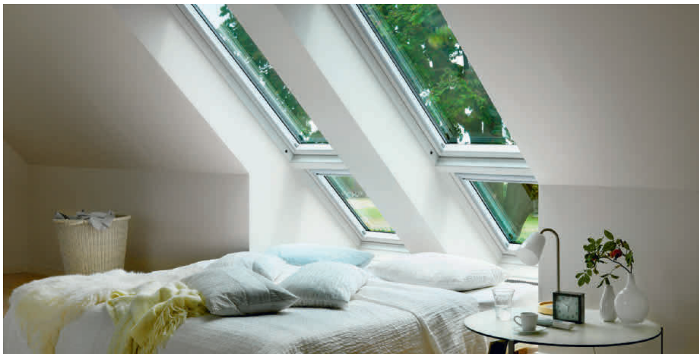
Schlafzimmer mit Dachfenstern

prüft und gereinigt werden. Laub und Verschmutzungen können den Wasserabfluss behindern und zu einem Wassereintritt führen. Bei häufigem Gebrauch empfiehlt es sich, die Scharniere und Bedienelemente jährlich zu fetten.