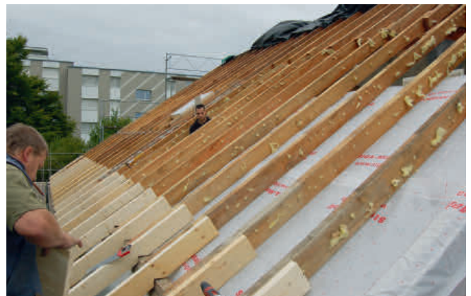
Vorbereitung für die neue Wärmedämmung

Der Einbau von Dachfenstern oder sogar Lukarnen bringt Licht in den Dachstock und ermöglicht zusätzlichen Wohnraum. Auch wenn dieser vielleicht nicht sofort genutzt wird, macht es Sinn, diese Varianten zu prüfen. Der nachträgliche Einbau von Dachfenstern und Lukarnen ist meist mit Qualitätseinbussen und höheren Kosten verbunden. Ebenfalls prüfenswert ist