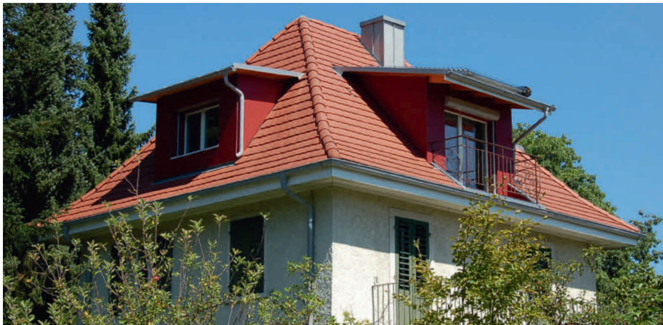
Saniertes Dach mit neuen Lukarnen

der Einbau einer Photovoltaik-Anlage. Bei geeigneten Dachflächen kann damit Strom produziert und eine Rendite generiert werden.